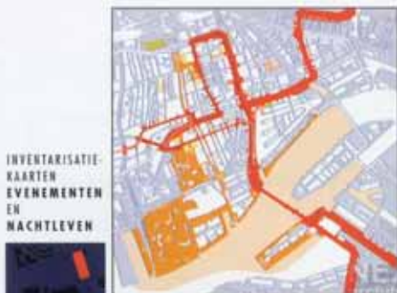
INVENTARISATIE- KAARTEN EVENEMENTEN EN NACHTLEVEN